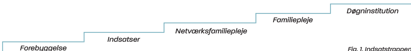
Fig. 1. Indsatstrappen

Indsatserne på hele området for udsatte børn og familier, og effekterne af disse indsatser, følges tæt. Det er afgørende, at eksisterende såvel som nye indsatser løser de konkrete problemer og skaber varige forandringer. Et tilbud skal gøre en positiv forskel for det udsatte barn eller familie, ellers skal tilbuddet gentænkes, erstattes eller fjernes. En given indsats skal ikke være en indsats for indsatsens eller kommunens skyld. Indsatsen skal være et tilbud, der er til for borgernes skyld.