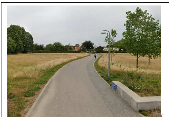
Figur 1: Musiconstien