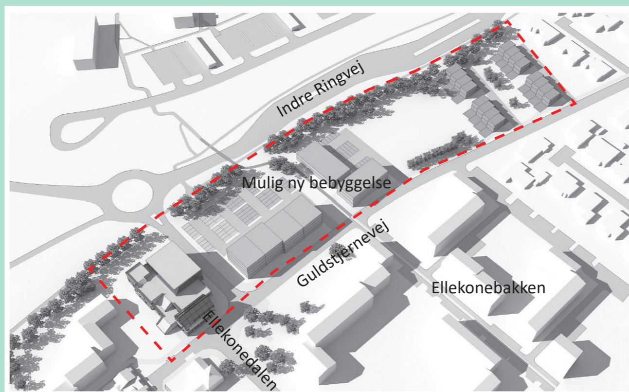
Visualisering af hvordan området kan udnyttes set mod nordvest.