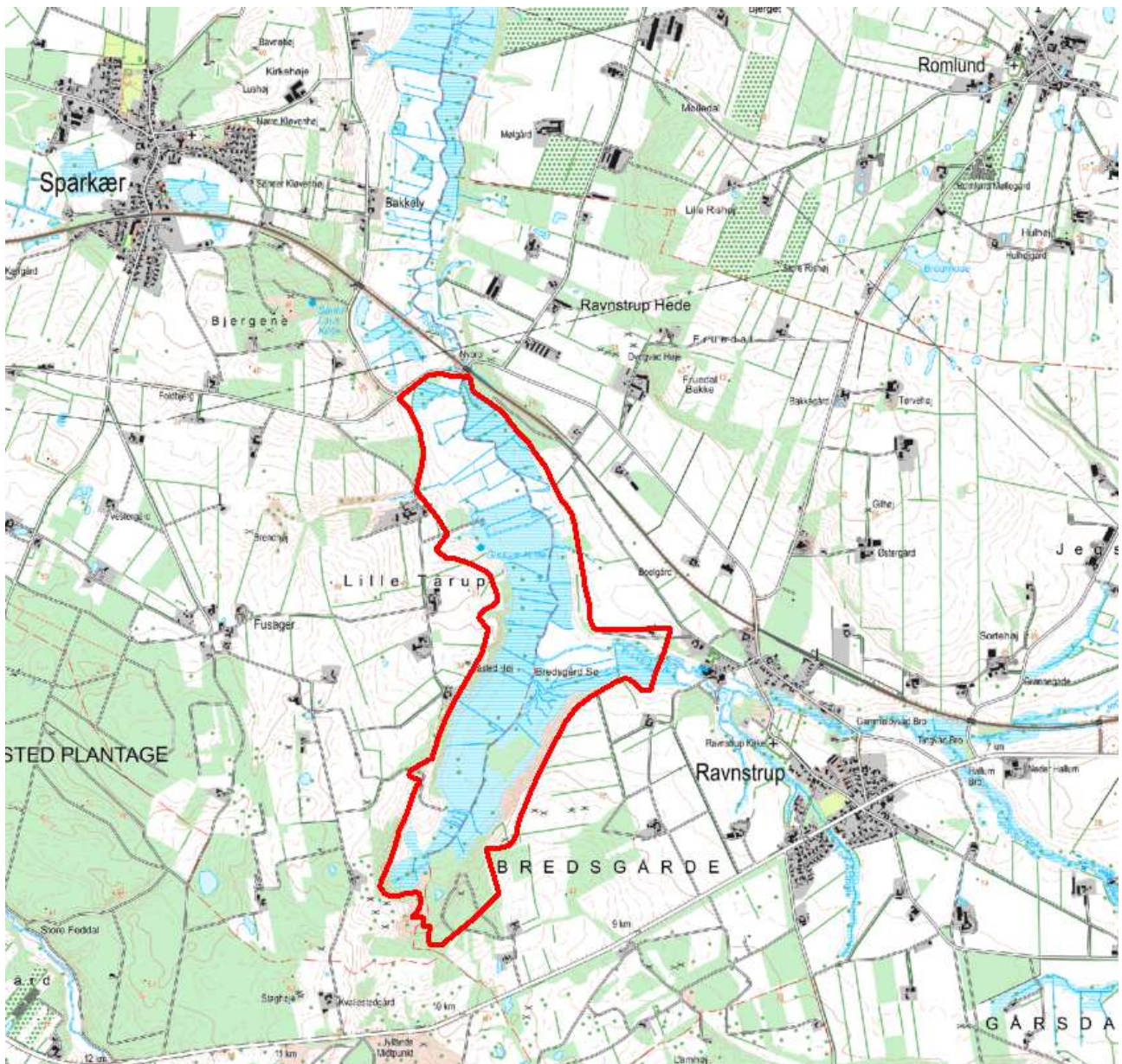
Kortet viser Natura 2000-område nr. 38 Bredsgård Sø (rødt område).

Indsatsen udføres af lodsejere i området og gennemføres i videst muligt omfang gennem frivillige aftaler. Der findes blandt andet en række tilskudsordninger, som kan søges gennem Landbrugs- og Fiskeristyrelsen.